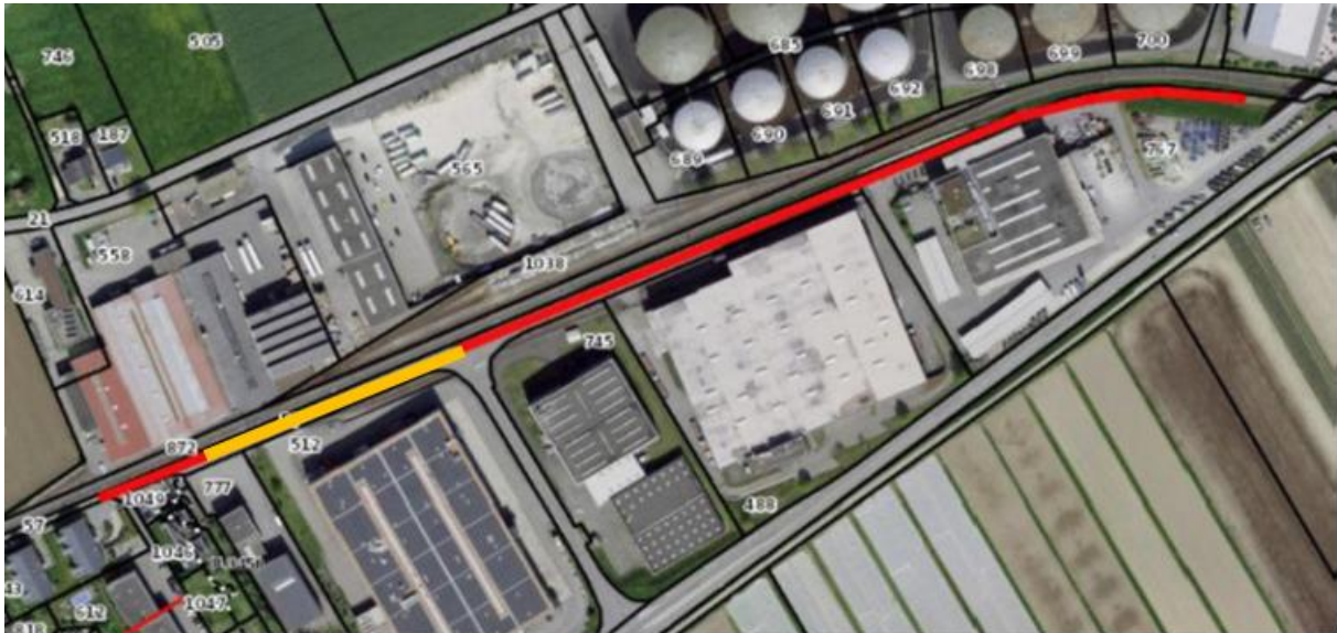
Abbildung 1: Projektperimeter (rot = Leitungersatz / gelb = Leitungersatz in Arbeit)

Ein flächiger Ersatz des Strassenbelags ist nicht vorgesehen und es wird lediglich der Belag im Grabenbereich ersetzt. Sämtlich Arbeiten in der Nähe des Gleisbereichs werden mit der Aare Seeland mobil AG koordiniert.